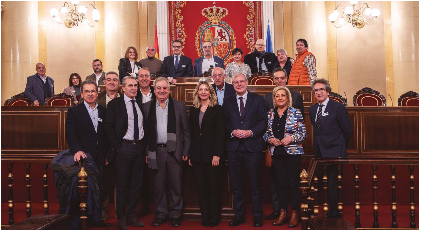
Los asistentes a la visita en el antiguo Salón de Sesiones