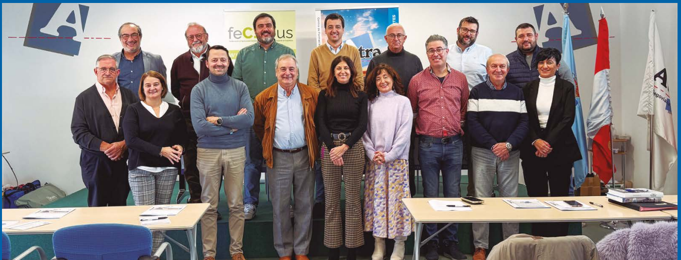
Socios de Asetra y representantes de la Junta de Castilla y León tras la reunión