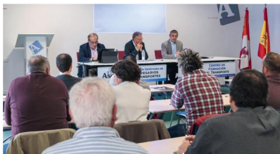
Intervención del presidente de FETRACAL, ante los socios de Asetra Segovia